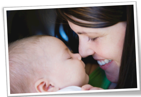
Ouderschap. Kinderen zijn onze spiegels

De online training relatietherapie en psychiatrie heeft een open inschrijving wat betekent dat het niet uitmaakt welke dag je invoegt omdat het allemaal losse onderwerpen zijn die allemaal even belangrijk zijn.